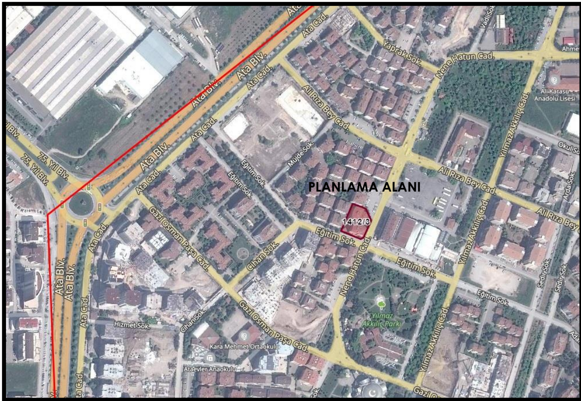
Şekil 2: Planlama Alanının Ulaşım İlişkileri