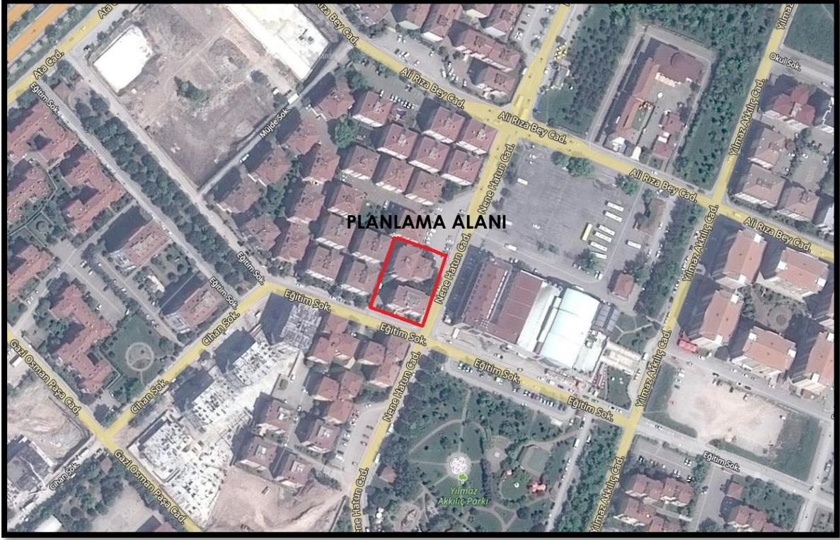
Şekil 1: Planlama Alanının Bölge İçerisindeki Konumu

Bursa İli, Nilüfer İlçesi, Ataevler Mahallesinde bulunan yaklaşık 1646,44 m 2 büyüklüğünde olan planlama alanı yakın çevresinde ağırlıklı olarak Konut Alanları, Yeşil Alanlar ve Ticaret Alanları bulunmaktadır.